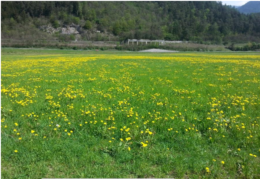
Mit PLOCHER, Mai 2015

Kunde arbeitet mit plocher gülle & jauche und seit Herbst 2013 mit plocher bodenaktivator 1-2-3 (heute plocher humusboden ). Kontrolle, Boden ist offen und Kunde hat großes Problem mit der "Gemeinen Risse" (im Bild nicht zu sehen). Wir haben 2013 die erste Behandlung mit plocher bodenaktivator 1-2-3 je 300 g pro Hektar angefangen, anschließend jeweils zwei Behandlungen pro Jahr. Im August 2014 kann man sehr gut erkennen, dass die Grasnarbe jetzt geschlossen und die Gemeine Risse kaum vorhanden ist.