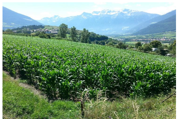
Mit PLOCHER, Juni 2014

Bei der Kontrolle wurde keine behandelte Gülle ausgebracht, hingegen beim Mais mit PLOCHER wurde behandelte Gülle und zusätzlich plocher bodenaktivator 1-2-3 (heute plocher humusboden) ausgebracht. Wie man sehr gut erkennen kann, ist der Mais im Bild rechts viel dichter und auch größer.