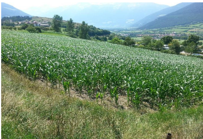
Kontrolle, Juni 2013

Seit 2013 plocher gülle & jauche hier im Einsatz, wie man sehr gut erkennen kann, keine Schwimmschicht alles voller Blasen. Bereits nach 2 Jahren hat die Gülle eine grünliche Farbe, ist homogen, kein ständiges rühren mehr und stinkt nicht mehr beim Ausbringen. Durch den Einsatz von plocher gülle & jauche wird Ihre Gülle zu einem wertvollen Dünger für den Boden.