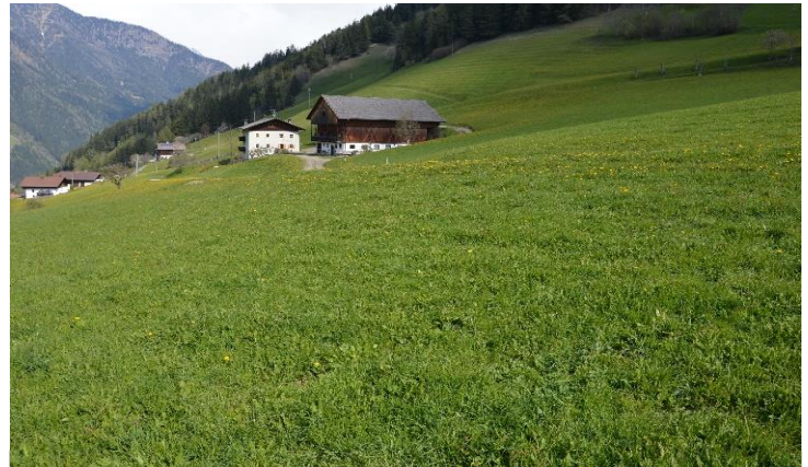
PLOCHER: Nach 3 Behandlungen mit plocher humusboden

Im Oktober 2014 waren in der Wiese offene Stellen sichtbar. Im Frühjahr 2015 haben wir mit plocher humusboden angefangen, bis Frühjahr 2016 drei Behandlungen. Wie man sehr gut erkennen kann, sind keine offenen Stellen im Boden sichtbar, fast keine Unkräuter mehr und das Gras wächst sehr dicht.