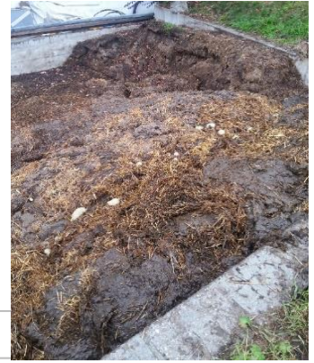
Mit PLOCHER, nach 1 Monat

Ende Oktober 2014 mit plocher kompost & mist im Stall mit 5 g pro GVE angefangen, nach einem Monat sieht man schon an den Schaumblasen wie der Mist arbeitet. Im Stall konnte man schon weniger Amoniak feststellen.