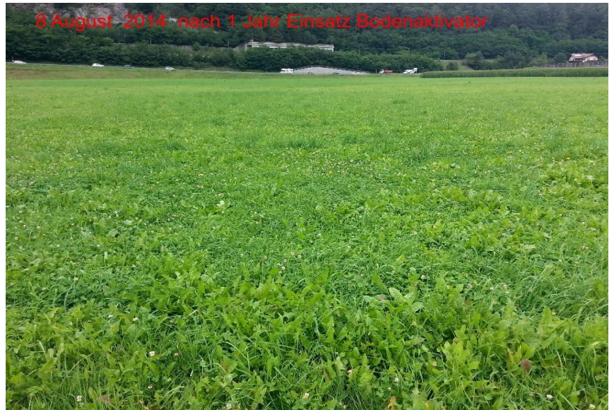
Mit PLOCHER, August 2014

Kunde arbeitet mit plocher gülle & jauche und seit Herbst 2013 mit plocher bodenaktivator 1-2-3 (heute plocher humusboden ). Kontrolle, Boden ist offen und Kunde hat großes Problem mit der "Gemeinen Risse" (im Bild nicht zu sehen). Wir haben 2013 die erste Behandlung mit plocher bodenaktivator 1-2-3 je 300 g pro Hektar angefangen, anschließend jeweils zwei Behandlungen pro Jahr. Im August 2014 kann man sehr gut erkennen, dass die Grasnarbe jetzt geschlossen und die Gemeine Risse kaum vorhanden ist.