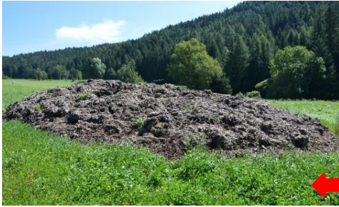
Mit PLOCHER, Misthaufen nach 7 Monaten

Im Januar 2015 war kein Amoniakgeruch im Stall festzustellen und der Mist war schön homogen und abgeschlossen. Der Kunde brachte den Misthaufen dann zur Lagerung auf die Wiese.