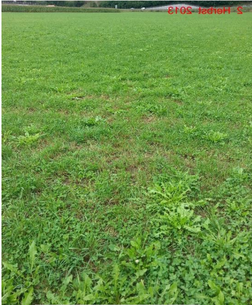
Kontrolle, Herbst 2013